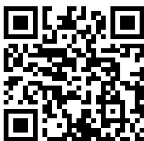
《企业文化建设成熟度评价指南》团体标准